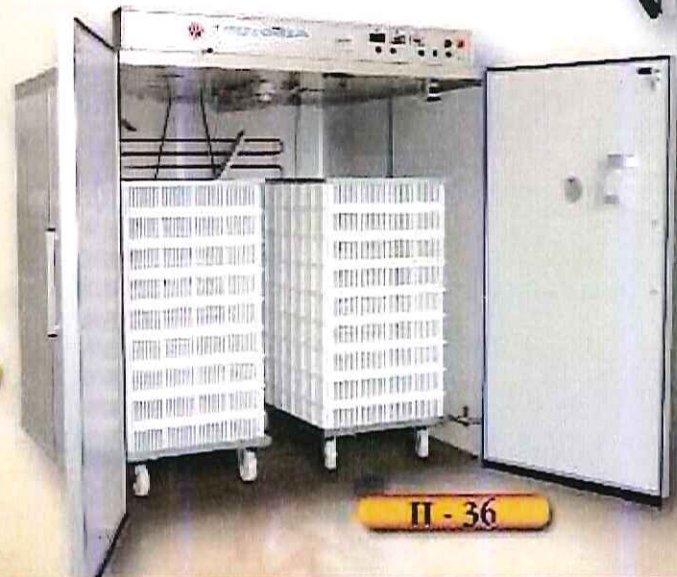
H - 36