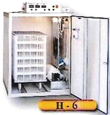
H - 6