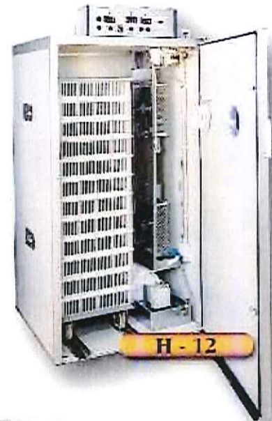
H - 12