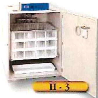
H - 3